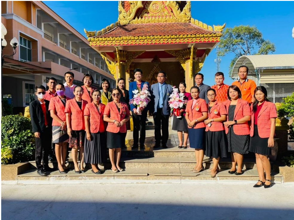
รับ-ส่ง ครูและบุคลากรทางการศึกษาย้าย