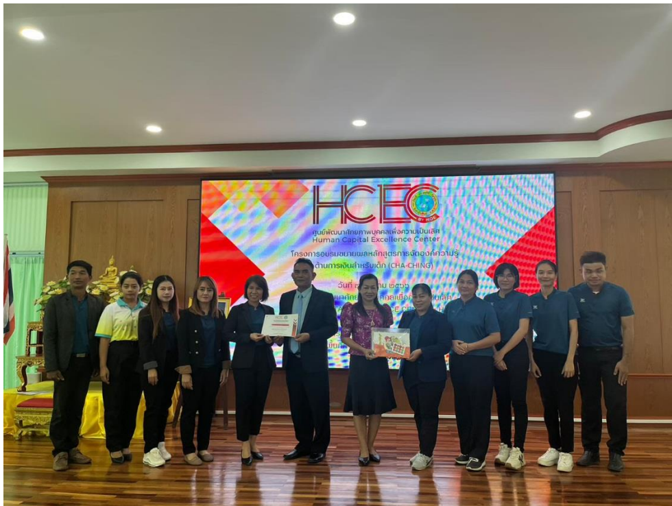
การอบรมโครงการศูนย์พัฒนาศักยภาพบุคคลเพื่อความเป็นเลิศ (HCEC)