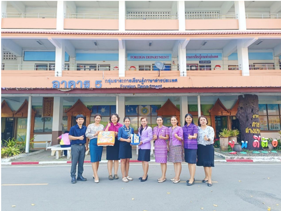
ขวัญกำลังใจ