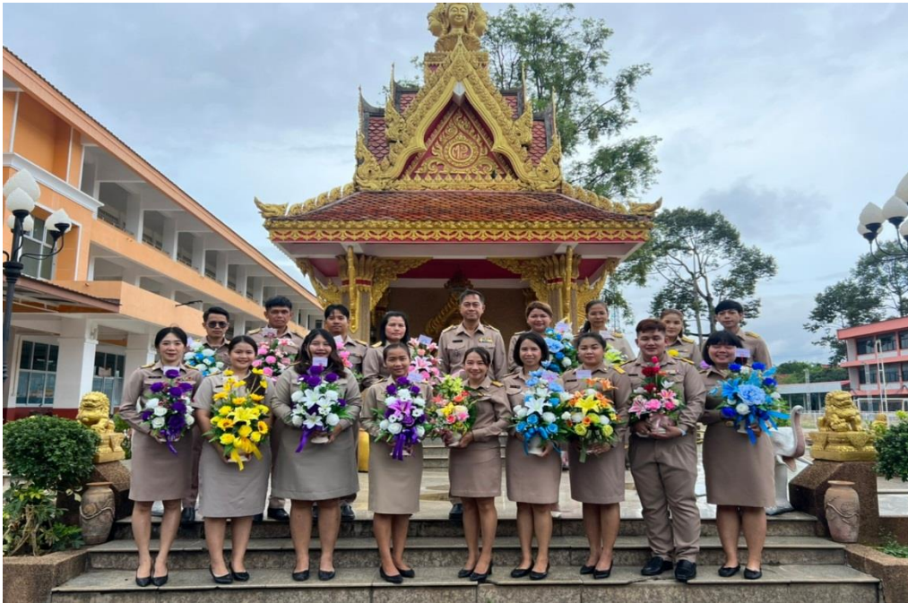
รับ-ส่ง ครูและบุคลากรทางการศึกษาย้าย