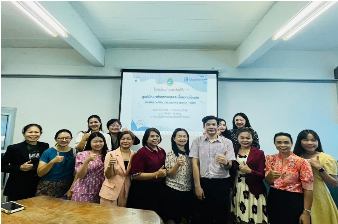
การอบรมโครงการศูนย์พัฒนาศักยภาพบุคคลเพื่อความเป็นเลิศ (HCEC)