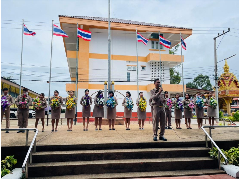
รับ-ส่ง ครูและบุคลากรทางการศึกษาย้าย