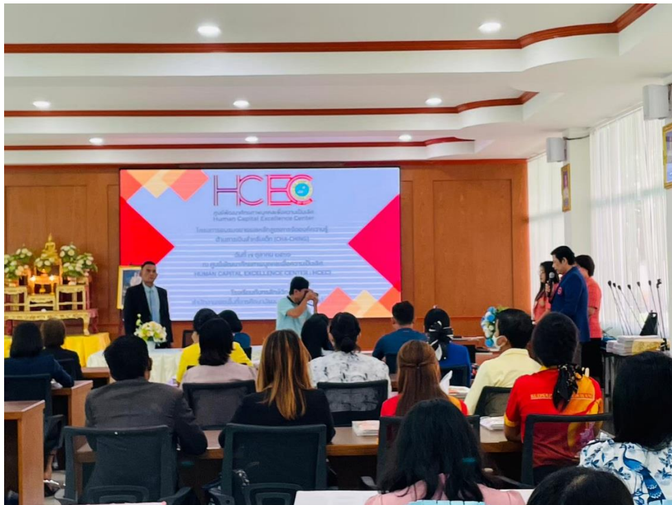
การอบรมโครงการศูนย์พัฒนาศักยภาพบุคคลเพื่อความเป็นเลิศ (HCEC)