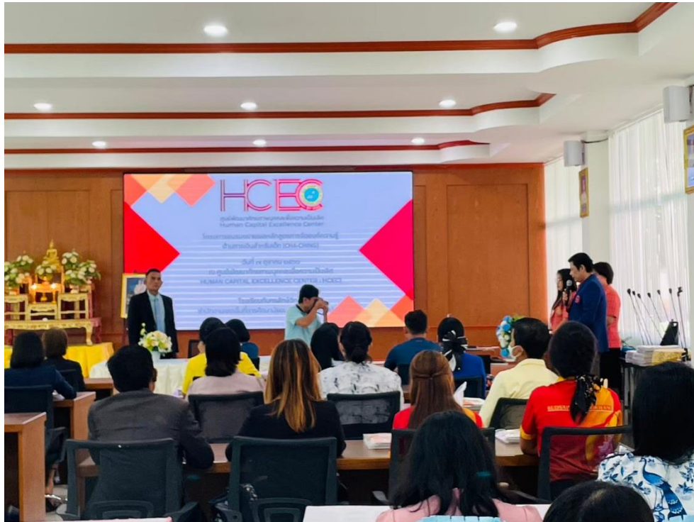
การอบรมโครงการศูนย์พัฒนาศักยภาพบุคคลเพื่อความเป็นเลิศ (HCEC)