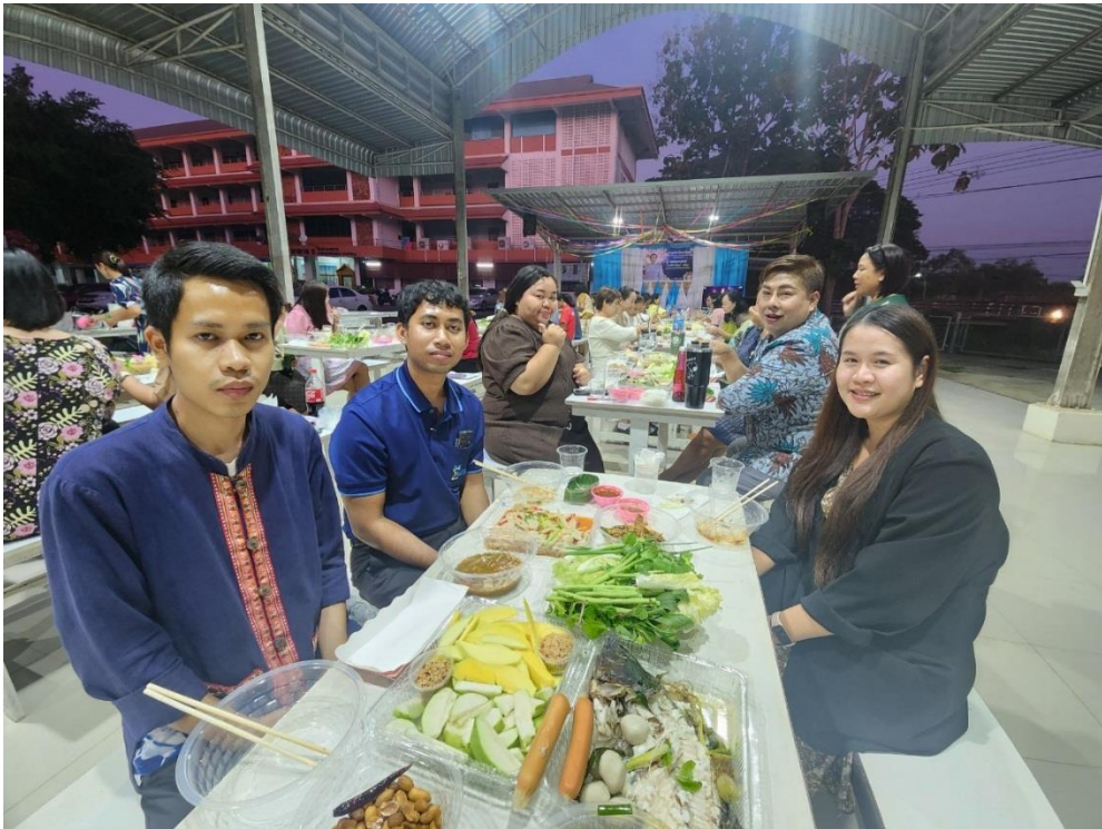
รับ-ส่ง ครูและบุคลากรทางการศึกษาย้าย