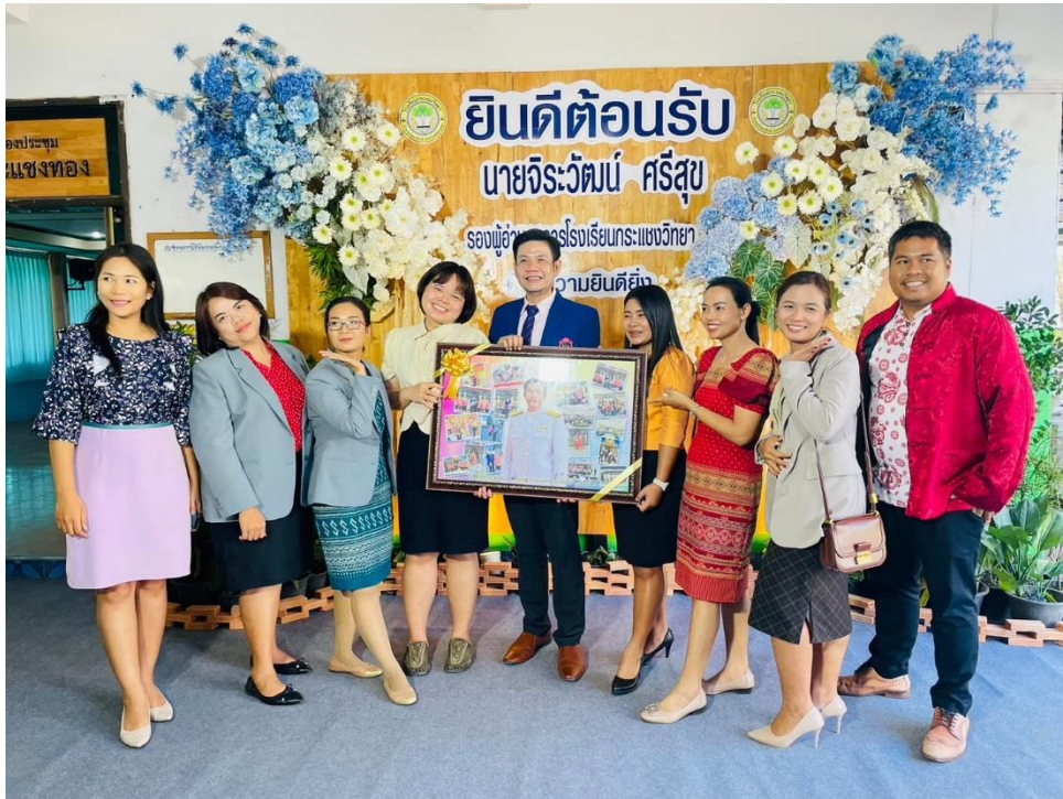
รับ-ส่ง ครูและบุคลากรทางการศึกษาย้าย